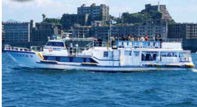
◎軍艦島周遊・上陸クルーズの見学コース